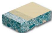
Структурное с Sikadur®-513